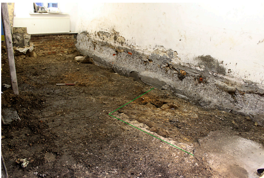
Figur 3: Ovnens ses i det nederste del af billedet i den grønne markering. I det område, hvor målestokken ligger, er hele området meget domineret af varmepåvirket materiale, som måske stammer fra ovnkappen til selve ovnen.

Den sydlige del af huset var præget af den nedbrudte ovnkappe. Der har formentlig været en form for planering, hvori den nedbrudte ovnkappe har været i. Det ses som et meget løst materiale i orange farve. Det er desuden fyldt med kridtnister og trækulsnister.