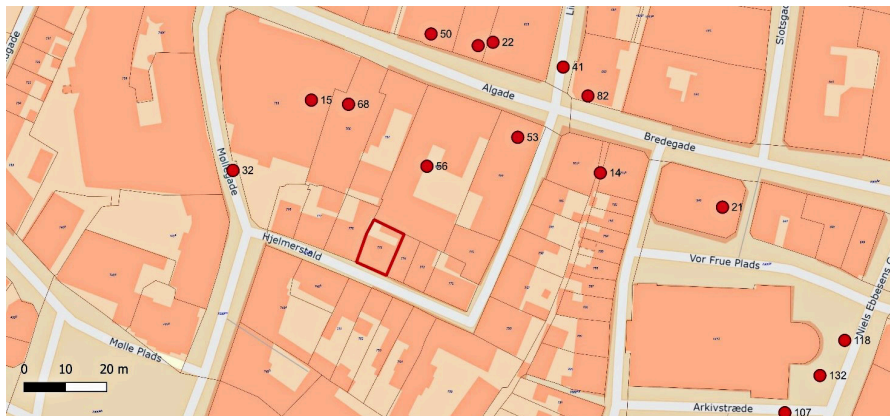
Figur 1: Placeringen af den aktuelle grund Hjelmerstald 16 i det centrale Aalborg angivet med rød polygon. Desuden er vist tidligere FF-lokaliteter med rød prik (lok. nr.). Matriklen hedder i dag såvel som i 1700-tallet matrikel 775.

I forbindelse med en ombygning af byhuset Hjelmerstald 16 i Aalborg skal der bortgraves 40 cm kulturlag i hele bygningens indre flade på ca. 47,3 m 2 . Et område på 2 m 2 skal dog have en større dybde på ca. 90 cm til en vinkælder.