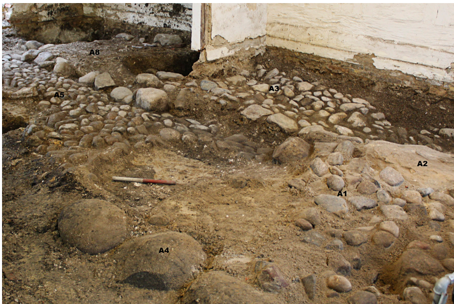
Figur 2: Her ses de forskellige niveauer. Det ses tydeligt, hvordan A5 går under blandt andet A3.