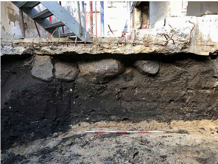
Fig 4: Sten, måske renæssancekælder, T4, A6, SFØ. Det er formentlig en kælder, selvom den ikke ligger ud til gaden som man ellers ser i renæssancen

Måske er der tale om spor efter en kælder, som der er tale om i A6, selvom den ikke ligger ud til gaden som man ellers ser i renæssancen (ÅHM4158). Men det kan også ses som syld, der bærer et bindingsværkshus. I al fald bliver der efter opfyldningen bebyggelse ovenpå.