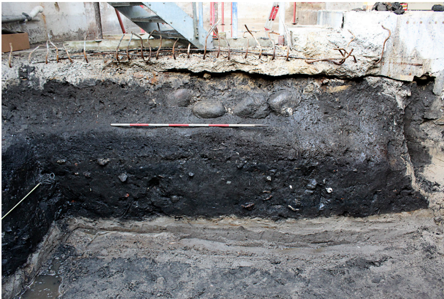
Fig. 3: Østvendt profil A1, A2, A4 og A6, SFØ. Øverst ses 4 sten (en del af A6). Ved nedbrydningen af profilen blev disse sten fjernet og umiddelbart vest for fremkom flere i samme niveau.

Undergrundskoten ligger i 1,21 DVR90 (fig. 3 og 4). Over A1 i denne profil ligger 4 sten med en diameter på 28-31 cm (A6). Det var ikke helt tydeligt i begyndelsen om det var lagt ned tilfældigt eller om det var meningen. Efter nedbrydningen af profilen, hvor stenene blev fjernet, var det tydeligt at det formentlig er meningen, da der fremkom endnu flere sten (fig. 4). Stenene vest for var endnu større end de forreste med ret stor forskel med en diameter på helt op til 90 cm.