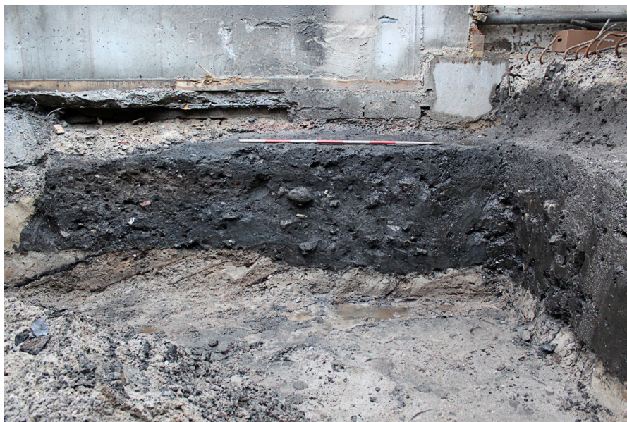
Fig. 2: Nordvendt profil A1, A2, A4 og A5, SFN. Fyld i voldgraven. Til højre ses den østvendte profil, T3

A5 ses som en nedgravning i nordvendt profil med en sandet struktur. Der er kulturlag blandet med gult sand og der ses flere teglbrokker (tagtegl og gule munkesten) og mange sten. Der ses altså de samme komponenter som A3, men formentlig ikke samme anlæg. Det tolkes som en nedgravning i voldgravsfyldet.