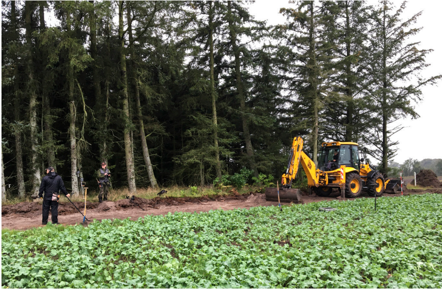
Fig. 4. Udgravningsfoto med afsøgning af feltet.

Det er påfaldende, at langt hovedparten af mønterne (ca. 56 stk.) er 2 skillinge og derfor at regne som hverdagsmønter. Andre samtidige skatte indeholder ofte flere daler- og markmønter. Fordi hele skatten sandsynligvis er optaget, giver denne skat et vidnesbyrd om brugen og opsparingen af almindelige hverdagsmønter. Oplysninger, skattefund kun indeholdende daler- og markmønter, ikke kan give.