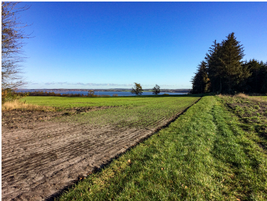
Fig 2. Fundstedet er højt beliggende i landskabet.

Ved undersøgelsen fremkom 60 metalfund, heraf 53 mønter, hidrørende fra skatten. Den samlede skat er således på 83 mønter. Derudover fandtes en borgerkrigsmønt fra middelalderen, tre knapper og to ubestemte metalgenstande. Det er meget sandsynligt, at hele resten af skatten er optaget, om end det ikke helt kan afvises, at enkelte mønter stadig findes på marken.