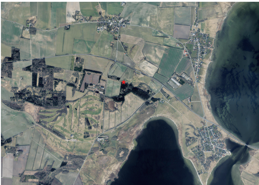
Fig. 1. Luftfoto med angivelse af fundstedet for møntskatten. Nord er opad.

På Original 1 kortet over Barmer ligger fundstedet som agerjord, men da det ligger tæt op ad ejerlavsgænsen, og der er hede på den anden side af ejerlavsgænsen, er det en mulighed, at der ikke har været agerland i 1600-tallet, men at det har været overdrev eller hede.