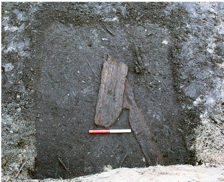
Figur 3. I den østlige del af felt 1 fandtes enkelte plankerester, som sammen med fund af nedrammede pæle, kan have indgået i et hegn fra 15-1600-tallet.

Selvom nutidens bebyggelse i mellemtiden gradvist har bredt sig ind på den gamle vådbund, var der under udførelsen af tracégravningerne store problemer med, at de nye huse så at sige gyngede som følge af vibrationer, der forplantedes gennem de plastiske jordlag fra projektets tunge maskiner. At vi ikke stødte på rester af ældre bebyggelser på området, kom derfor ikke som nogen overraskelse, men i stedet var der tegn på, at området på et tidspunkt kan have været udnyttet som engareal, evt. som græsningsareal for mindre husdyr. I den østlige del af felt 1 blev der fundet 7 nedrammede pæle med en diameter på 10-15 cm. De var alle tilspidsede, og dannede til sammen et relativt fragmenteret øst-vest orienteret forløb over en strækning på ca. 11 meter.