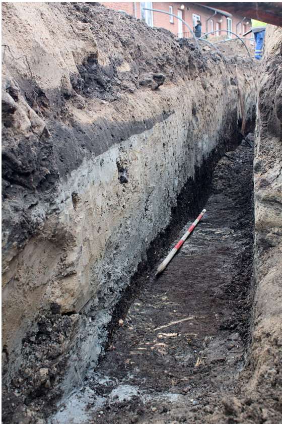
Figur 2. Profilsnit i Fjordgade. I bunden ses de organiske naturlige aflejringer med plantedele fra den tid, hvor området blot bestod af et vådområde. Herpå ses et tykt lag lyst gråt silt, som i nyere tid er spredt ud for at stabilisere terrænet.

Ved undersøgelsen blev der overvåget i alt seks felter, hvoraf to lå som en del af et vandtracé langs Fjordgade, mens de resterende fire lå i området mellem Vestergade og Rosengade.