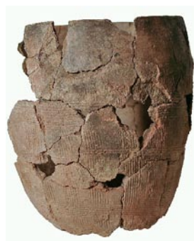
Udvalgte skår fra affaldsgruberne syd og øst for huset.