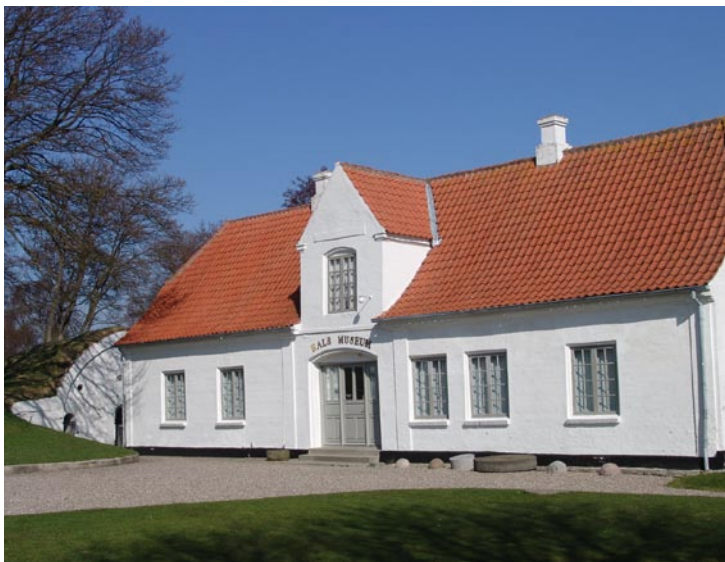
Hals Museums udstillingsbygning, Tøjhuset i Hals Skanse. Tøjhuset er efter alt at dømme opført i 1790'erne. Krudtkammeret i baggrunden er opført 1676.

Det største og mest markante levn er imidlertid samtidig ramme om udstillingen, nemlig den velbevarede Hals Skanse, som man må bevæge sig ind i og gennem for at nå frem til museet. En flottere ramme, der samtidig er en væsentlig del af indholdet, kan man næppe ønske sig.