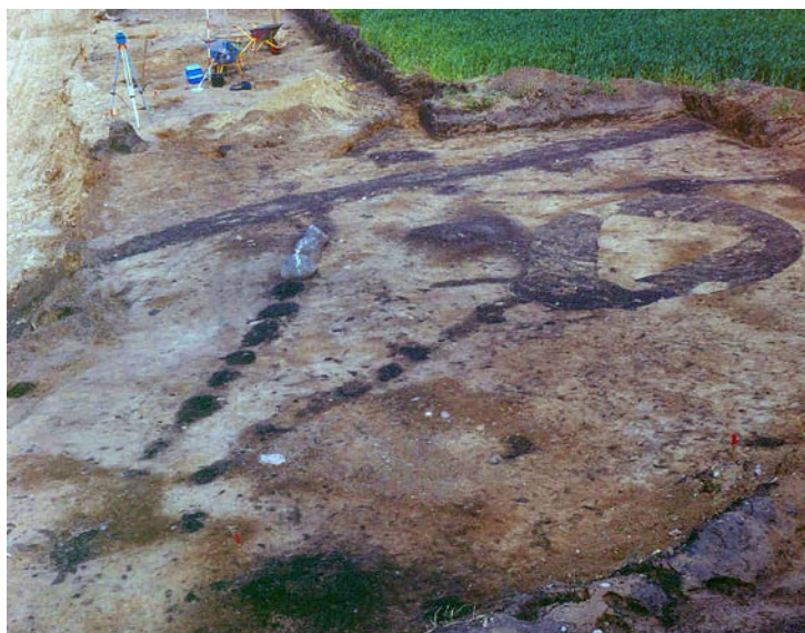
Graven med den trekantede stensætning.

De øverste dele af en anden urnebrandgrav var også ødelagt af nutidig dyrkning. Urnen var usædvanlig stor og indeholdt ca. 4 kilo brændte knogler. Der var ingen trækul i urnen, kun knogler, hvilket må tages som udtryk for, at materialet fra ligbålet er rensset, inden det