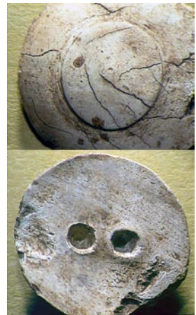
Spillebrikker af ben fra den store urne. Nogle gange er der små gruber på den plane underside. Den hvælvede overside kan være drejet således, at der er dannet en lille forhøjning omkring centrum. I andre tilfælde er der små cirkler på oversiden.

De videre analyser af gravene fra Postgården har vidtrækkende perspektiver. Det gælder forholdet til den samtidige bebyggelse og den store variation i gravskikken på samme gravplads. Set i forhold til gravmateriale fra andre samtidige lokaliteter som Sejlflod og Lindholm Høje, så aner man store ligheder i materialet, men også en stor grad af variation. Set i dette lys, og fordi de resterende grave på lokaliteten er stærkt truede af dyrkning, blev gravpladsens udstrækning uden for vejtracéet dokumenteret i dette års udgravningskampagne. Disse områder blev taget ud af dyrkning med henblik på, at museet vender tilbage i den nærmeste fremtid for at foretage en egentlig udgravning.