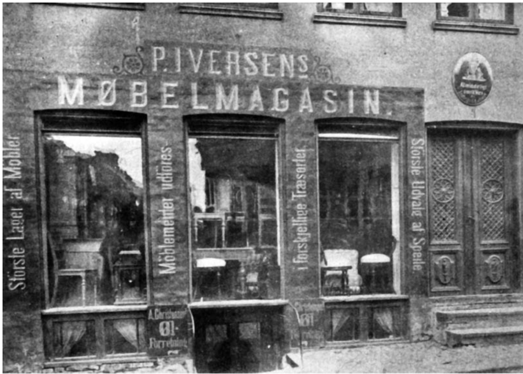
Fotografi fra sidst i 1800-tallet af Algade 3. Husets bindingsværk er ændret til grundmur, og 1600-tals kælderen ses med en trappenedgang flankeret af to mindre vinduer.