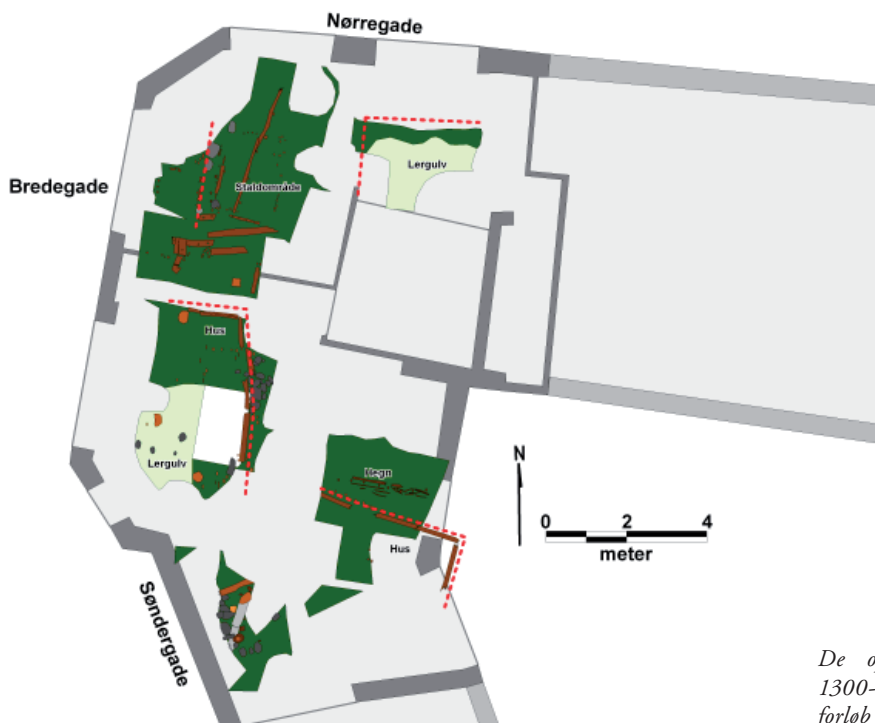
De opmålte husrester fra 1300-tallet med mulige vægforløb markeret i rødt.

med ovnen midt i og et åbent teglbelagt ildsted foran. Gulvet her har været stampet ler, udbedret af flere omgange med læsket kalk.