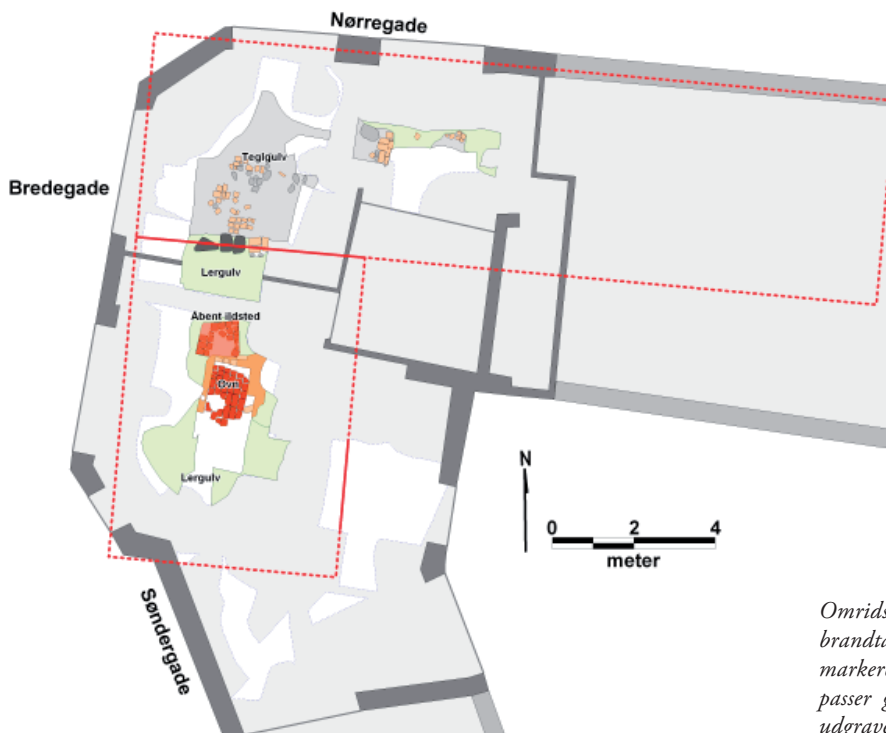
Omridset af husene nævnt i brandtaksationen fra 1761 markeret med rødt. Husene passer godt sammen med de udgravede gulvlag.

Huset har været et bindingsværkshus - en hustype, der dominerede Aalborg fra i hvert fald renæssancen og langt op i 1800-tallet, hvor nye huse i teglsten blev opført til afløsning af de gamle bindingsværkshuse.