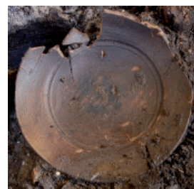
Tallerkenen er drejet ud af asketræ og næsten intakt. Diameter 24 cm.

Jo længere tilbage i tid vi gravede os på grunden, jo sværere blev det at stykke historien sammen. Det er anlæggene fra 1300-tallet et godt eksempel på. Nu fandtes der ikke længere markante gulvlag, men i stedet de tykke organiske lag, og bebyggelsen blev svær at erkende i puslespillet af felter. Byggeskikken er anderledes end i 1400- og 1500-tallet, husene er typisk opført med jordgravede stolper eller over et fodtømmer lagt direkte på jorden. Et sjældent indblik i tidens huse blev det dog til, idet et stykke af en væg var væltet og efterfølgende dækket af lagene. Væggen var derved blevet bevaret. Fragmentet afslørede, at mindst et af husene på grunden har haft vægge af pileflet beklasket på begge sider med kalkholdigt ler i en tykkelse på op til 15 cm.