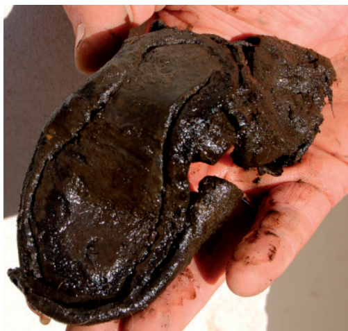
Den lille barnesko er størrelse 21, og har passet til et barn på ca. 2 år.

Puslespillet blev trods manglende brikker samlet og fortæller om grundens historie gennem 200 år fra 1300-tallet til 1500-tallet. En periode, hvori grunden går fra at ligge i den østligste udkant af Aalborg, hvor man kunne holde kvæg ud til hovedgaden, til i renæssancen at ligge på byens hovedstrøg og bebygget med et stort solidt bindingsværkshus. Det hus, der for 150 år siden måtte vige pladsen for det nu nyrenoverede hus for enden af Bredegade. Men historien er ikke fortalt færdig, for gemt under husets betongulve ligger der stadig kulturlag gemt. Det vil være op til arkæologer langt ude i fremtiden at udgrave dem og fortælle om grundens historie fra Aalborgs tidligste tid.