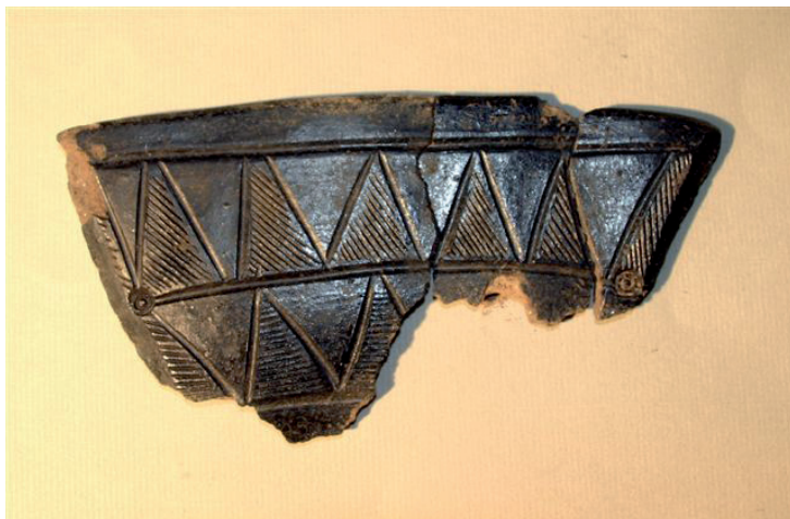
Ornamenteret skår fra fodbæger.

Huset har kun haft en indgang, nemlig midt i den sydlige langside. Umiddelbart uden for indgangen sås et lille vindfang, hvorfra en 10 meter lang brolagt sliske førte såvel folk som fæ op på jordoverfladen. I forbindelse med dokumenteringen af husets vindfang og indgangsbrolægning sås to nedgravninger, som syntes noget uforholdsmæssigt