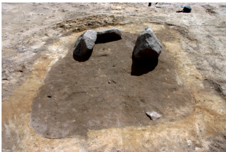
Jordfæstegrav A184 forud for udgravning.

afslører, at mennesker allerede i slutningen af bondestenalderen færdedes i det lettere kuperede landskab sydøst for den nuværende kirke i Vester Hassing.