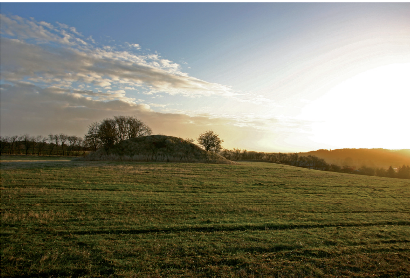
Velbevaret gravhøj ved Hvornum

kontinuerligt tilsyn er påkrævet for at sikre, at antallet af gravhøje og andre synlige minder ikke yderligere formindskes. I forbindelse med opstarten af det kommende tilsyn vil Kulturarvsstyrelsen informere landbrugsorganisationer, kommuner m.m. om museumslovens fredningsbestemmelser. Dette skulle sammen med selve tilsynet og den opfølgende sagsbehandling forbedre fortidsmindernes chancer for at overleve i et stadigt skiftende kulturlandskab. Det kommende tilsyn vil forløbe over de næste fire år, og en status i 2012 vil således afspejle, om tilstanden af fortidsminderne virkelig er blevet forbedret.