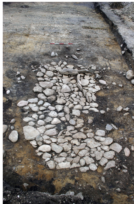
Stenbelagt gulv i det sydlige kammer.

Undergrundsoverfladen under højen var i øvrigt præget af ardspor, og højen er øjensynligt blevet anlagt på en markflade. Et træk som i øvrigt hyppigt kan iagttages under vore gravhøje. I forbindelse med randstenskædens stenspor fandtes mod nordvest 2 dybe stolpehuller